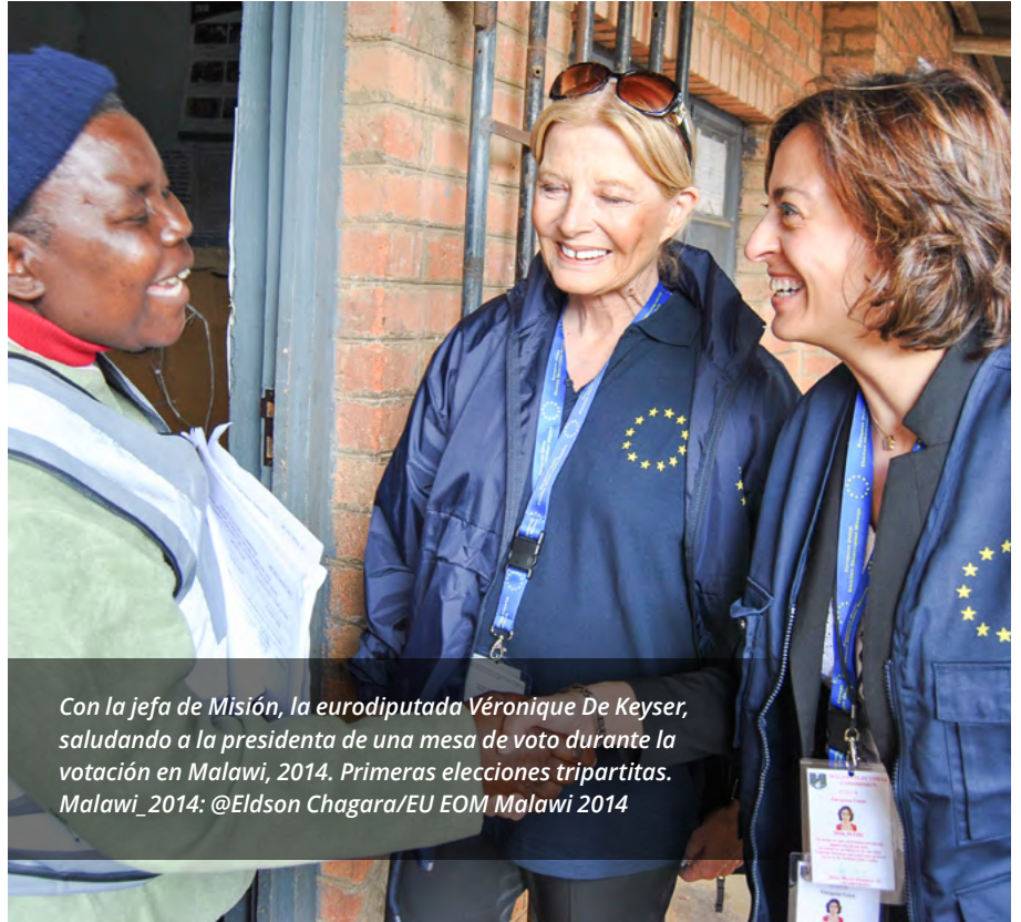
Con la jefa de Misión, la eurodiputada Véronique De Keyser, saludando a la presidenta de una mesa de voto durante la votación en Malawi, 2014. Primeras elecciones tripartitas.

Las MOE de la Unión Europea, que es la institución con la que más he colaborado, son uno de los principales instrumentos de diplomacia del Servicio Europeo de Acción Exterior (SEAE). El apoyo a la democracia, la buena gobernanza y los derechos humanos forman parte de los pilares fundacionales de la Unión Europea, que desde el año 2000 ha desplegado más de 300 misiones. El SEAE, junto con la Comisión Europea, los Estados miembro y el Parlamento Europeo, seleccionan los países prioritarios a los que enviarán una MOE, ▶